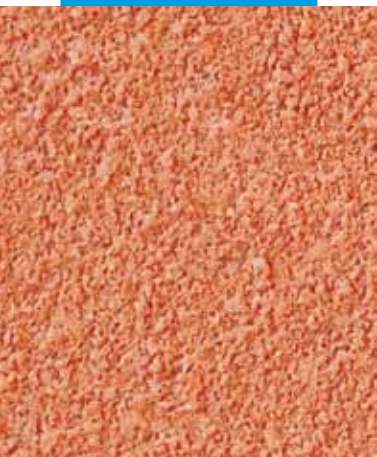
Крупный план Quarzolite Tonachino на фасаде здания, г. Фигерас Испания.

Quarzolite Tonachino устойчив ко всем климатическим условиям и агрессивному воздействию смога, соли и солнечного света.