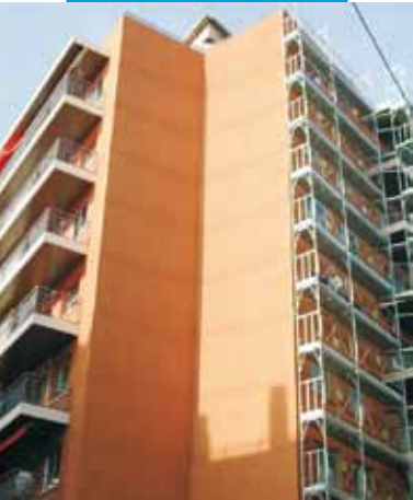
Пример нанесения Quarzolite Tonachino при строительстве жилых домов в г. Фигерас, Испания