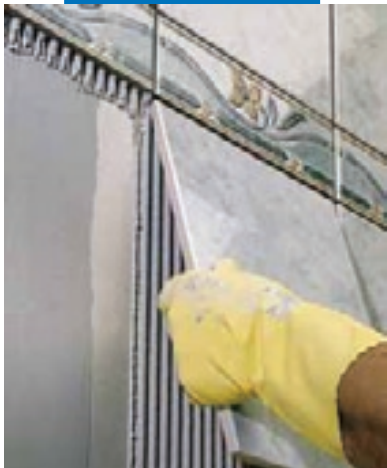
Укладка плитки ординарного обжига в качестве стенового покрытия поверх гипсовых панелей