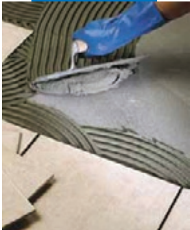
Укладка плитки ординарного обжига в качестве полового покрытия