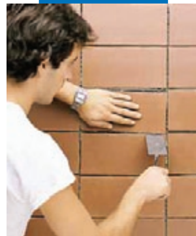
Время корректировки плитки – до 60 минут