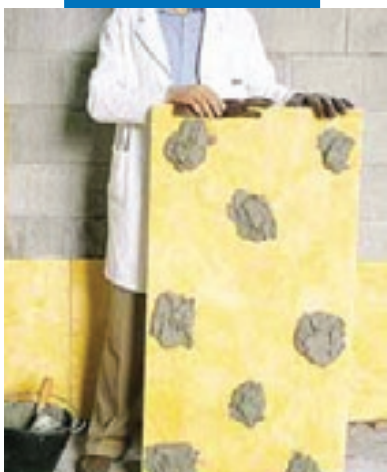
Клеевое крепление изоляционных панелей на неотделанную стену

Список значимых объектов, где использовался данный материал, предоставляется по требованию.