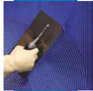
Нанесение Kerapoxy Design синего цвета в качестве клея при помощи зубчатого шпателя

Расход Kerapoxy Design зависит от ширины шва и размеров плитки. При заполнении швов в мозаики размером 2x2 см расход примерно составит 1,4 кг/м². При исполь-