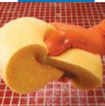
Смачивание поверхности перед очисткой