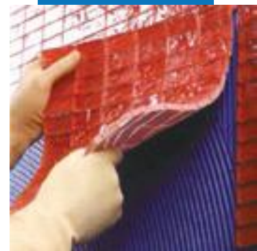
Укладка стеклянной мозаики с помощью Kerapoxy Design на стены