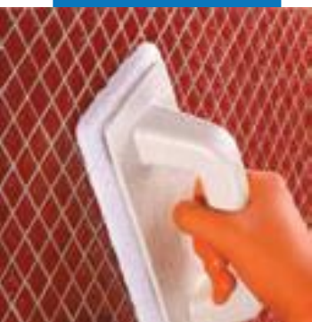
Очистка стеклянной мозаики влажной абразивной губкой Scotch Brite®