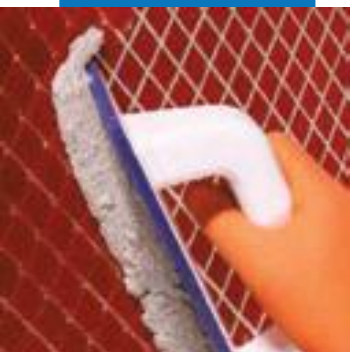
Нанесение Kerapoxy Design плоским резиновым шпателем